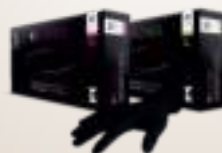
PÚDERMENTES KESZTYŰ M/L