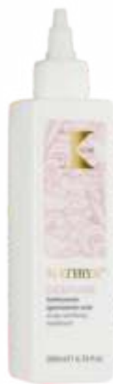
MATIRYA DEEPURE FEJBŐR TISZTÍTÓ FOLYADÉK 200ML

ÉPPÚGY, MINT A VILÁGEGYE- TEMBEN A SZINTÉZIS TÖKÉLETES A MINDENSÉG SZERVEZETT ÉS EGYENSÚLYBAN VAN AKKÉPEN MINT A DIVAT ÉS AZ EMBERI TEST KIFEJEZI UGYANAKKOR AZ EGYSZERŰ ÉS MEGFOGHATÓ ANYAG EGYENSÚLYÁT AMI A HAJBÓL ERED.