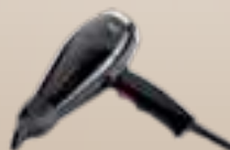
ORPHEUS HAJSZÁRÍTÓ 1800W