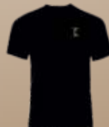
PÓLÓ S - XL