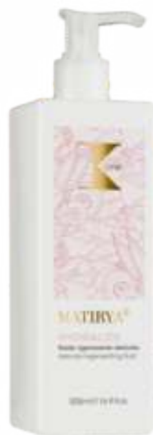
MATIRYA HYDRALIZE KÍMÉLETES REGENE- RÁLÓ TEJ 500ML

Teafoolaj, Propolisz és Csillagánizs kivonattal, melyek eltávolítják a fejbőrön található szennyeződések ezáltal támogatva az oxigénellátást és előkészítve a fejbőrt a speciális kezelések számára. Használata: Vizes fejbőrre vigye fel a készítményt és végezzen masszírozó, körkörös mozdulatokat. Hagyja 3 percig hatni, majd folytassa a választott speciális kezeléssel. PROFESSZIONÁLIS FELHASZNÁLÁSRA. KÜLSŐ ALKALMAZÁSRA.